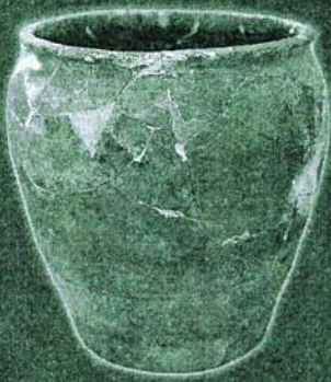
田原口城跡出土甕 (生駒市教育委員会蔵)