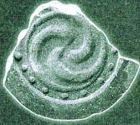
私部城跡出土軒丸瓦 (交野市教育委員会蔵)