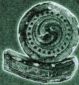
多聞城跡出土軒丸瓦・軒平瓦 (奈良市教育委員会蔵)